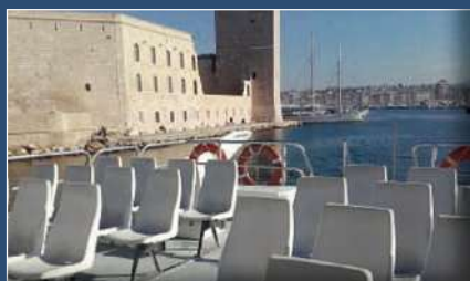
Pont panoramique Panoramic upper deck