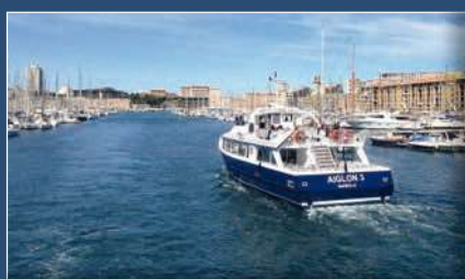
Aiglon III sortant du Vieux-Port Aiglon III coming out of the Vieux-Port