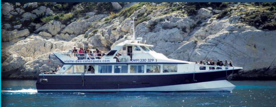
Aiglon III dans les Calanques Aiglon III into the Calanques

“Moment magique sur le pont panoramique.”